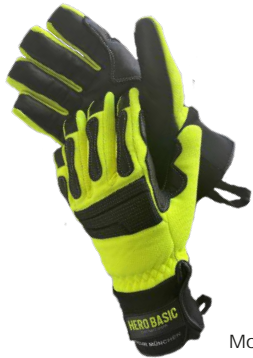
Modell: HERO BASIC GREEN

Markenfaser aus 100% Nomex III® orangefarben, Fluorcarbon imprägniert Flächengewicht ca. 185gr/m 2 ca. 8 cm lange Nomex® Comfort Strickstulpe; Flächengewicht ca. 450gr/m 2