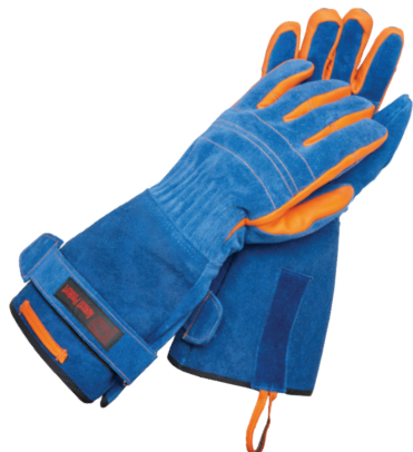
MODELL: FIREGRIP 2.0 short